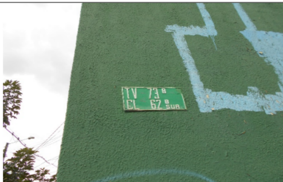
Foto 1.- Referencia del sitio de visita.

Radicado - 2020ER123784 de 24 de julio de 2020