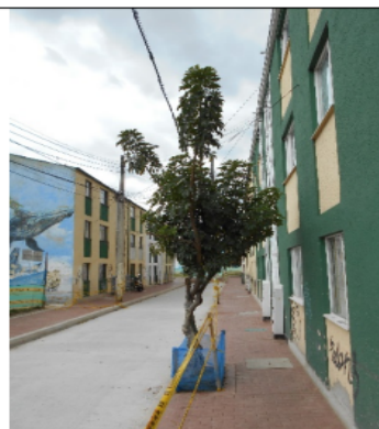
Foto 4.- Vista general al momento de la visita del árbol evaluado.